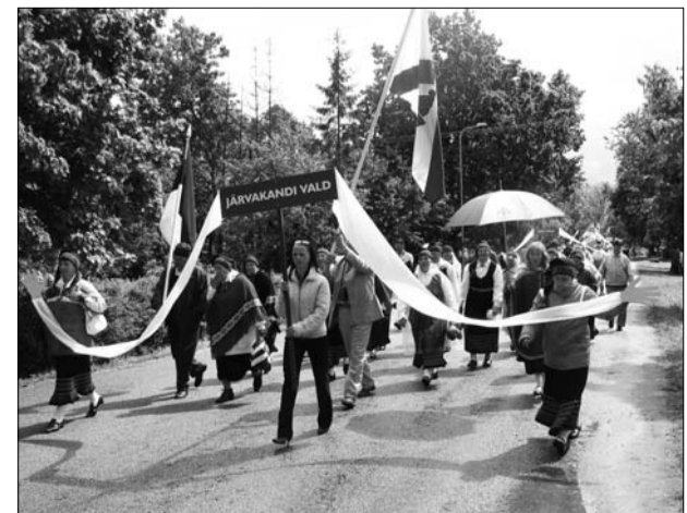
Segakoor maakonna memme-taadi peol.