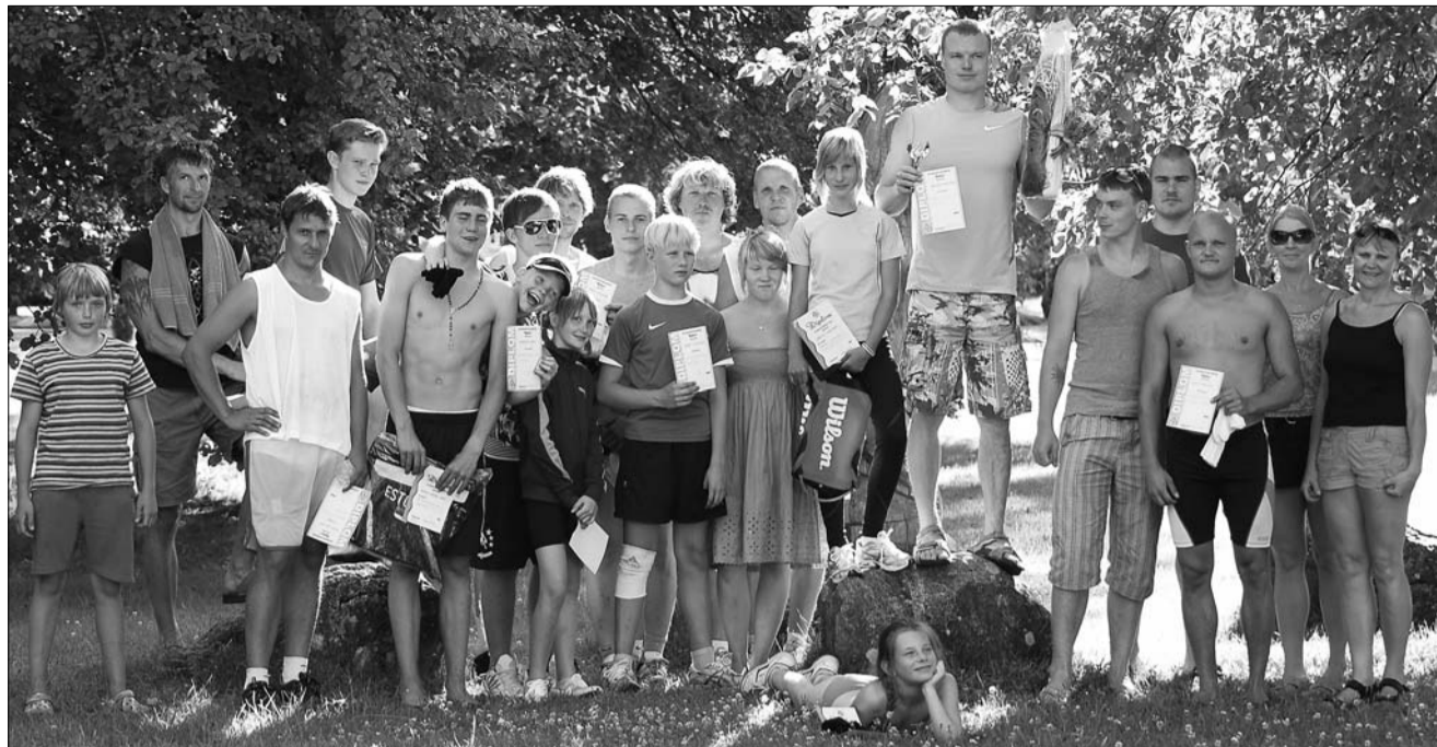
Mitmevõistlejad pärast autasustamist.