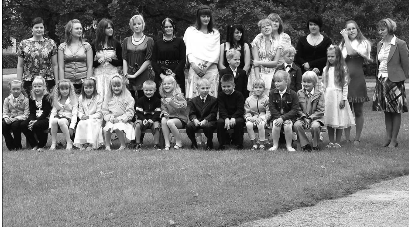
1. ja 12. klass avaaktusel.