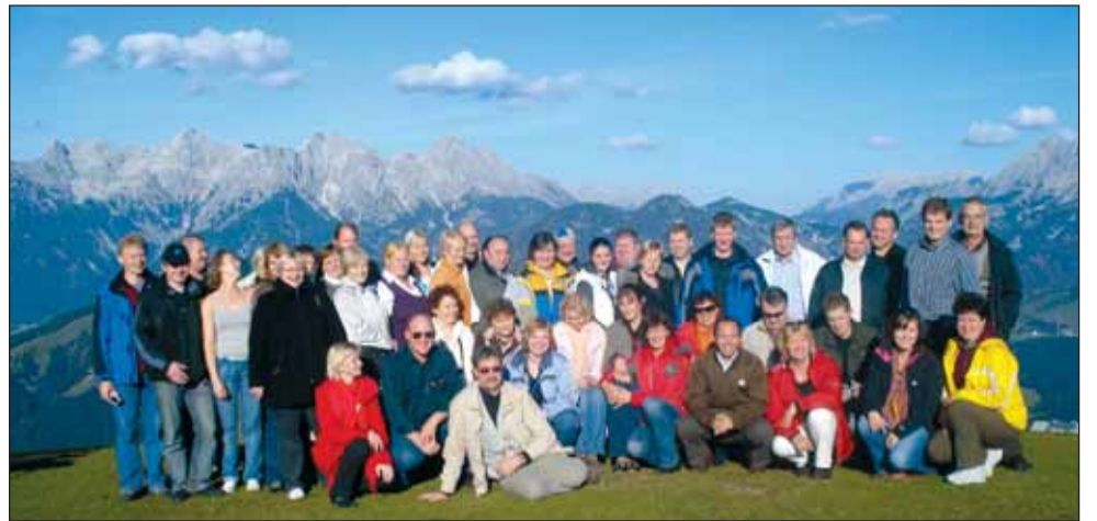
Austria mägede vahel.

Austria põllumajanduses domineerib väiketootmine. Kartulitalu 15 hektari kartuli-vagudega on suurtootja. Saak on kuni 600 ts/ha, niisutamis-süsteemi kasutades aga isegi kuni 1000 ts/ha. Maa on vii-