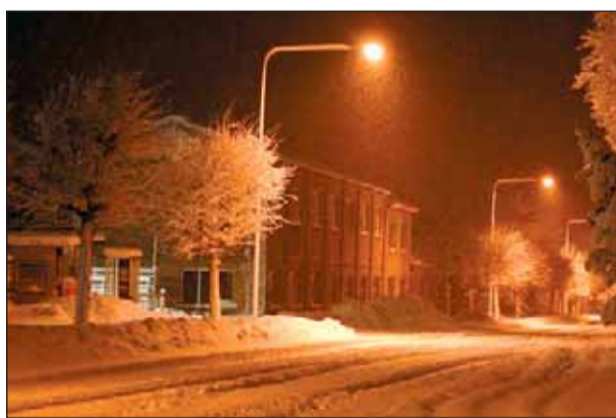
Hoolimata murtud okstest ja täis tuisanud teedest, pak-kus maha sadanud paks lumi toredat silmailu ning teki-tas mõnusa talvetunde.