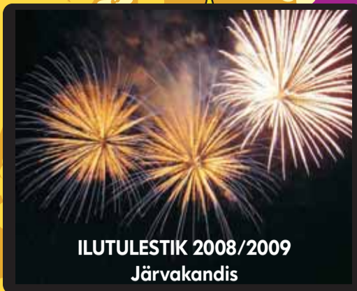
ILUTULESTIK 2008/2009 Järvakandis