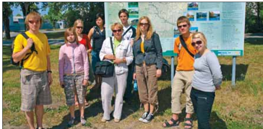
Noored fotograafid Järvakandiga tutvumas.