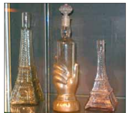
Tule näitust vaatama!