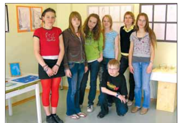
Klaasikunstiringi liikmed näituse avamisel.