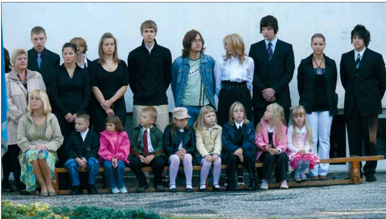
Esimene klass abiturientidega kooliaasta avaaktusel.