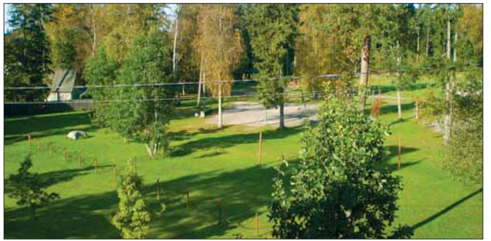
Koolimajatagune plats, kuhu annaks "joonistada" 300 m ringiga staadioni. Margus Sepp

Septembris toimuma pidanud algklasside piirkond-