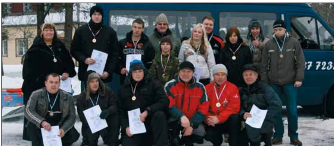
Lumeovaal 2009 medalivõitjad.

Oma sõiduoskusi käisid näitamas ka 10 mootorratturit (s.h üks tütarlaps), kes publikule tõelise elamuse pakkusid.